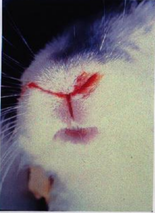
Example # 1