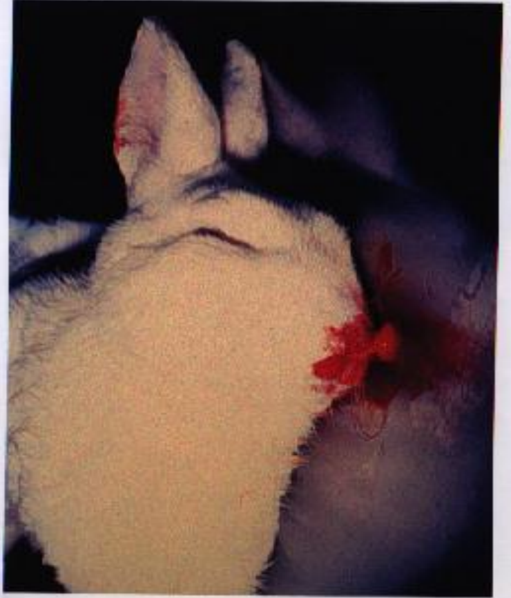
Example # 2